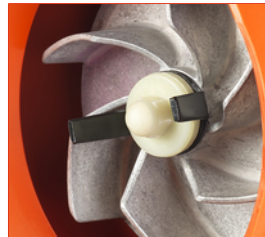
Häckseleinrichtung am EB-165 V